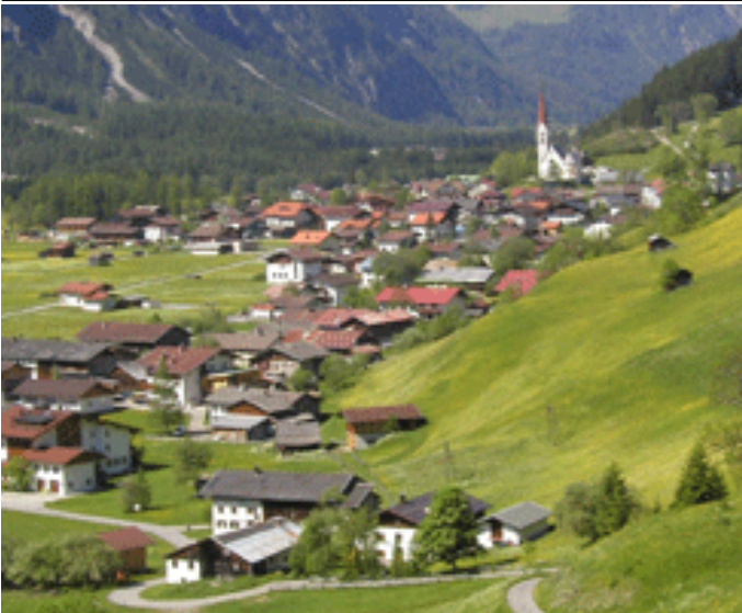
Autor Michael Kohler Quelle Tourismusverband Lechtal